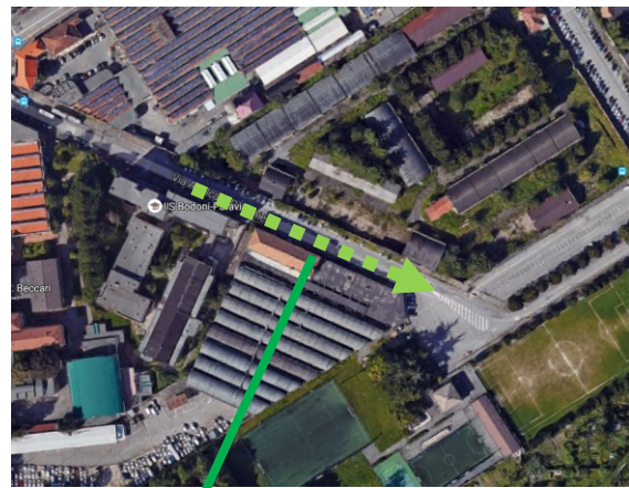
Percorso di esodo esterno