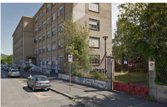
Accesso carroia n.1