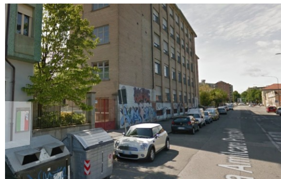
Accesso carroia n.2